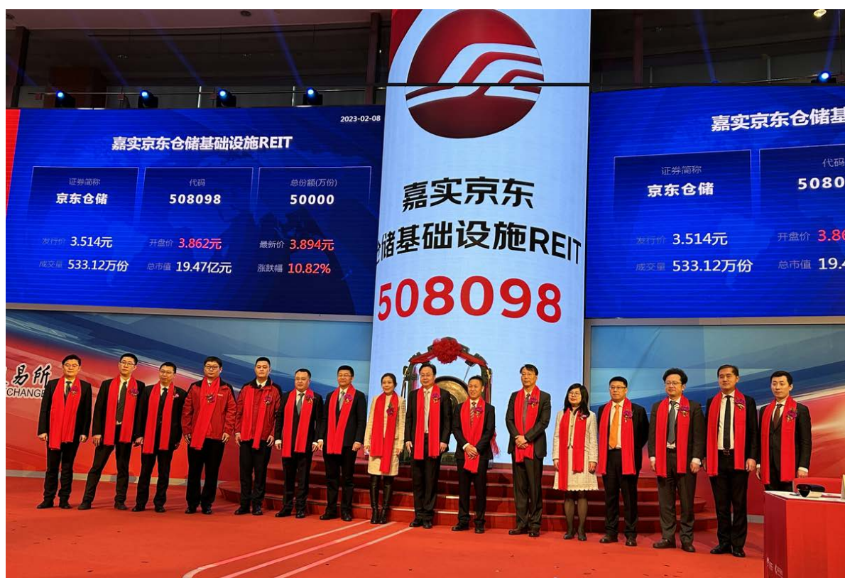
嘉實京東倉儲REIT正式在上海證券交易所上市。

2月8日，首隻民企倉儲公募REIT正式在上海證券交易所上市。據披露檔顯示，該倉儲基礎設施REIT基礎設施資產包括位於重慶、武漢和廊坊的3處物流園區，合計建築面積350,995.49平方米。項目資產出租率均達到100%，即滿租狀態，租約長度為5至6年。