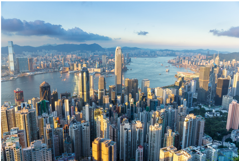
從山頂拍的維多利亞港。